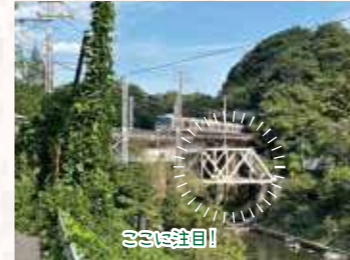
電車が通過するときがシャッターチャンス

1931年と翌年の地すべりで崩壊した亀瀬隧道(かめのせすいどう)の代替ルートに架けられた鉄道橋の一つ。川の流れを阻害しないよう橋脚を建て、主桁をトラス桁など別の橋桁で受けるという珍しい構造が鉄道ファンに人気だ。新年の伊勢参詣客輸送に間に合わせるために着工から約5か月で開通(単線のみ)させた技術にも驚き!