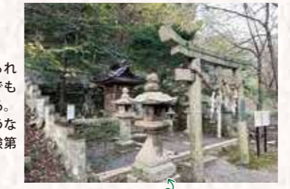
「剣先船(剣先船)」の銘がある石燈籠

大和川での舟運安全を願って祀られた神社。近頃は剣先船の船着き場でもあり、船仲間が奉納した石燈籠も残る。祠を正面から撮ると災いが起こるそうなので、脇から撮影。境内には葛城修験第二十八番経塚も。