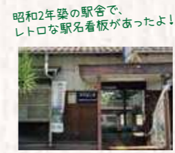
昭和2年築の駅舎で、レトロな駅名看板があったよ!

START JR三郷駅 運賃 140円 残金 1,884円 10分 JR河内堅上駅